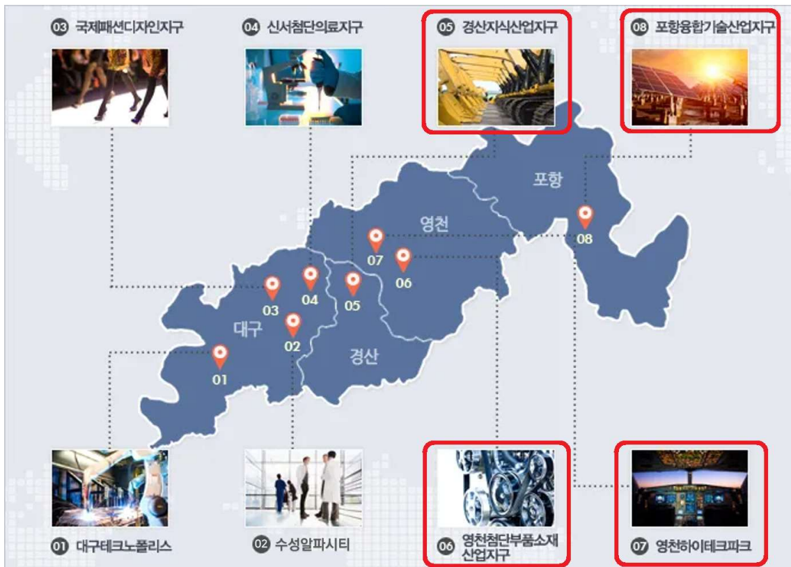
<경제자유구역(경북지구) 4개 지구 위치도>