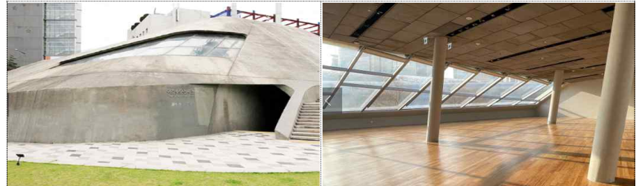
외부, 내부 전경

이간수문전시장은 전시 전용 용도로 371.69㎡(1층), 80명 수용가능 (지하 사용 불가능)